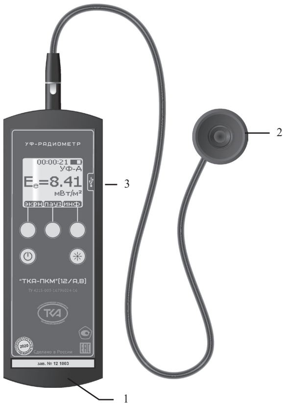
Рис.1 – Внешний вид прибора “ТКА-ПКМ”(12/А,В) 1 – Блок обработки информации 2 – Измерительная головка 3 – Технологический разъем