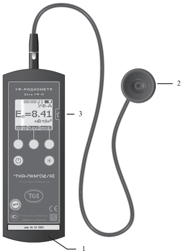
Рис.1 – Внешний вид прибора “ТКА-ПКМ”(12/А)