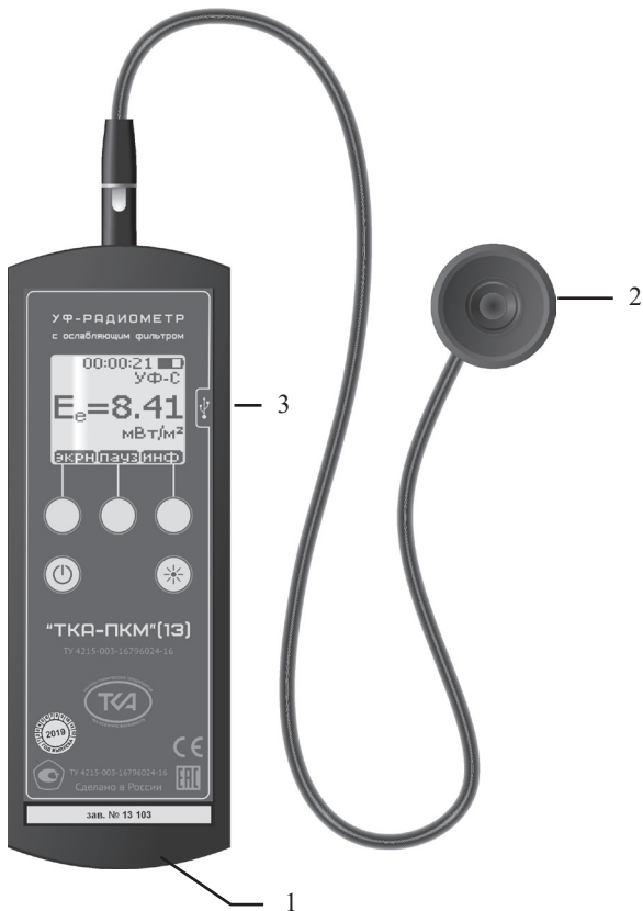
Рис.1 – Внешний вид прибора “ТКА-ПКМ”(13) 1 – Блок обработки информации 2 – Измерительная головка 3 – Технологический разъем