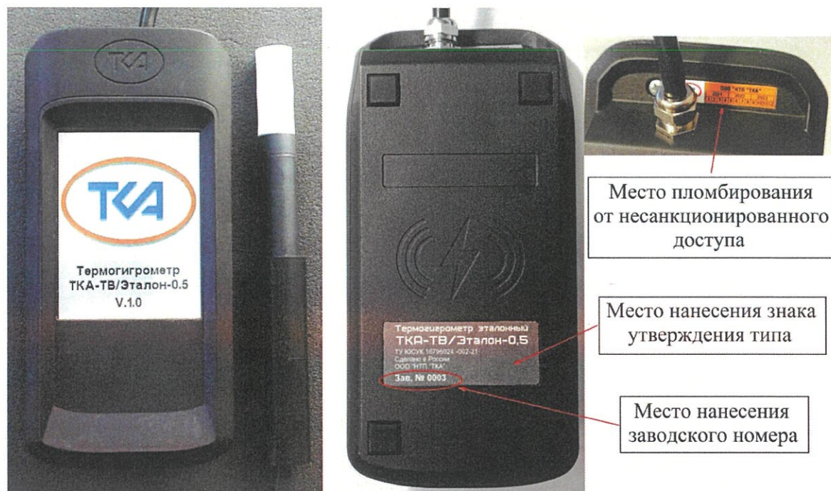
Рисунок 1 - Общий вид термогигрометра эталонного ТКА-ТВ/Эталон с указанием места пломбирования, нанесения знака утверждения типа и заводского номера

Общий вид термогигрометра с указанием места пломбирования, нанесения знака утверждения типа и заводского номера представлен на рисунке 1. Знак поверки наносится на свидетельство о поверке.