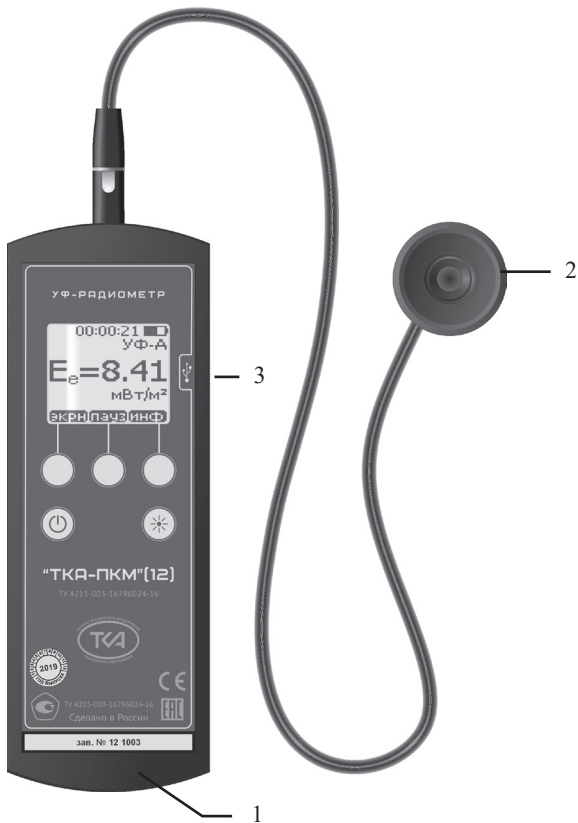
Рис.1 – Внешний вид прибора “ТКА-ПКМ”(12)